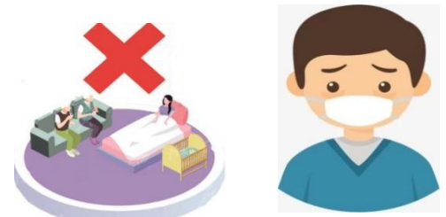
减少探视戴好口罩